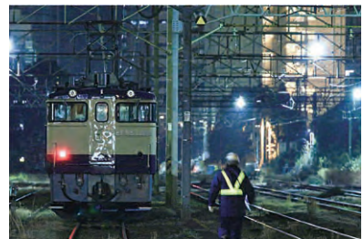
夜、光る 中村 太雅さん(中3)