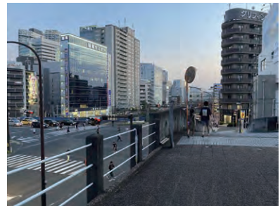
さあ 帰ろう！ 田邊 瑛大さん(小5)