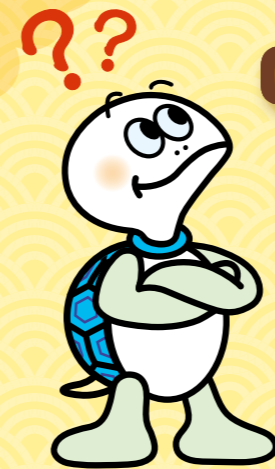
神奈川区 マスコットキャラクター 『かめ太郎』